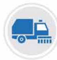
Подметально уборочные машины