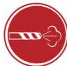
Обработки с минимальным количеством смазки (MQL)