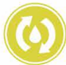
Система непрерывной циркуляции масла