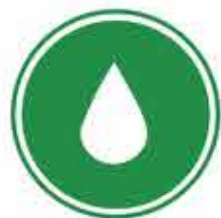
Проточная смазочная система